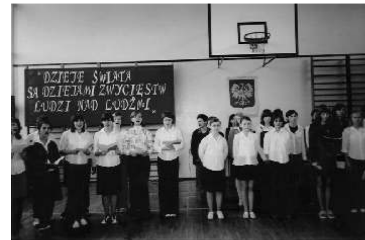
Występy uczniów z ZSG w Brudzewie w 214 rocznicę uchwalenia Konstytucji 3 Maja