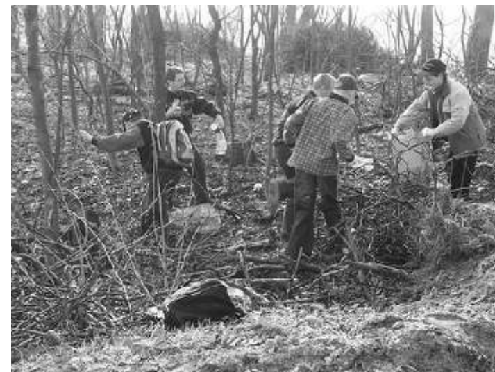
Dzieci z SP w Brudzewie przy sprzątaniu lasu w Brudzewie