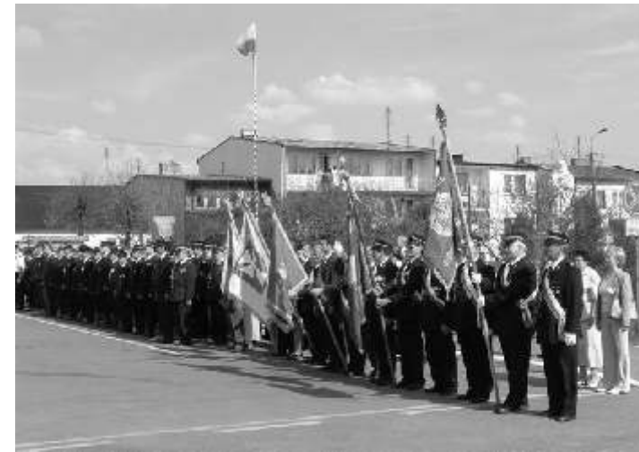
Pocztę sztandarową i strażaków z gminy Brudzew