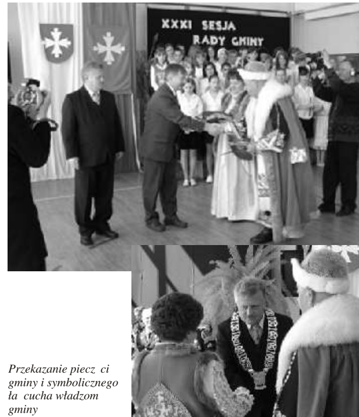
Przekazanie pieczęci gminy i symbolicznego łańcucha władzom gminy