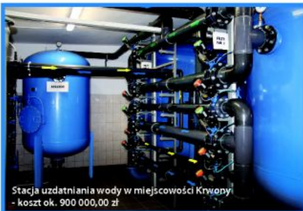
Stacja uzdatniania wody w miejscowości Krwony - koszt ok. 900 000,00 zł