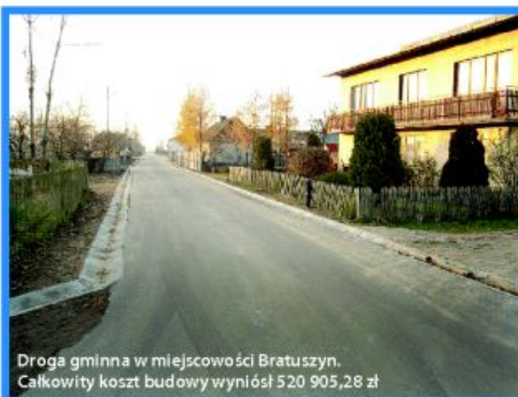
Droga gminna w miejscowości Bratuszyn. Całkowity koszt budowy wyniósł 520 905,28 zł