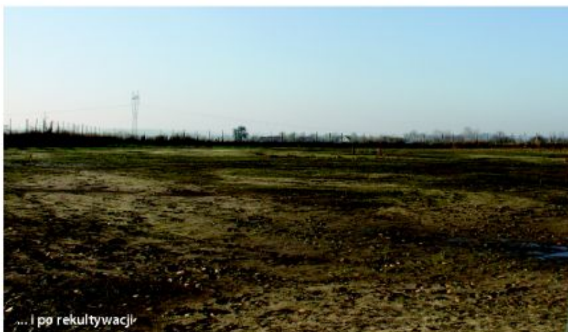
... i po rekultywacji

Prace w terenie trwały od stycznia do września bieżącego roku i zakończone zostały sukcesem. Istnieje również szansa na zwrot części poniesionych kosztów rekultywacyjnych w ramach realizowanego w tym celu projektu „Uporządkowanie Gospodarki Odpadami na Terenie Subregionu Konińskiego”.