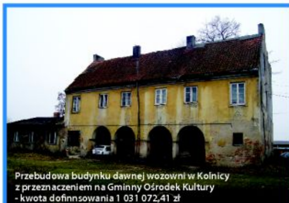
Przebudowa budynku dawnej wozowni w Kolnicy z przeznaczeniem na Gminny Ośrodek Kultury - kwota dofinansowania 1 031 072,41 zł