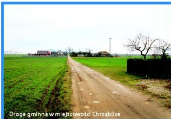
Droga gminna w miejscowości Chrząblice