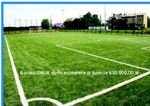
Boisko ORLIK dofinansowane w kwocie 650 000,00 zł

Szybszy rozwój naszej gminy zależy od pozyskanych środków zewnętrznych – unijnych i krajowych, dlatego przez cały czas przygotowujemy projekty wraz z wymaganą dokumentacją. W latach 2007 – 2009 udało się nam pozyskać prawie