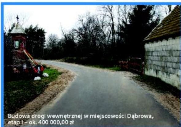
Budowa drogi wewnętrznej w miejscowości Dąbrowa, etap I – ok. 400 000,00 zł