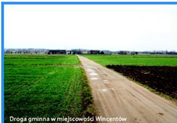
Droga gminna w miejscowości Wincentów