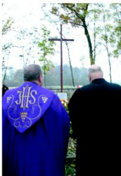
Ekumenicznie w Brudzewie

Modlitwa ekumeniczna, Modlimy się by być jedno w Kościele Jezusa Chrystusa. Uczymy się wspólnie miłości i tolerancji, uczymy się poznawać siebie, spotykać z ludźmi, rozmawiać i uczymy się wspólnego przebywania. Nasza obecność w tym dniu, to świadectwo