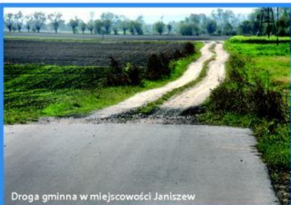
Droga gminna w miejscowości Janiszew

W 2010 roku planujemy zakończyć załatwianie procedur, które pozwolą na budowę tych dróg w kolejnych latach.