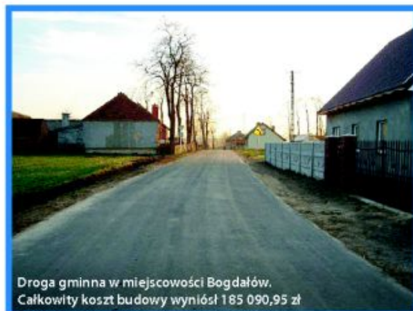
Droga gminna w miejscowości Bogdałów. Całkowity koszt budowy wyniósł 165 090,95 zł