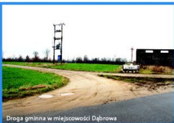
Droga gminna w miejscowości Dąbrowa

Każdy mieszkaniec naszej gminy chciałby, by to właśnie w jego miejscowości powstawały drogi, budowano sieć kanalizacji sanitarnej czy chodnik. Każdy z sołtysów i radnych ma wyznaczone cele, które dla mieszkańców jego miejscowości i okręgu który reprezentują są najistotniejsze. Jeżeli przez kolejny rok będziemy współpracować tak jak to miało miejsce do tej pory, jest szansa że większość założeń i planów, które są istotne dla mieszkańców poszczególnych miejscowości będzie realizowana.