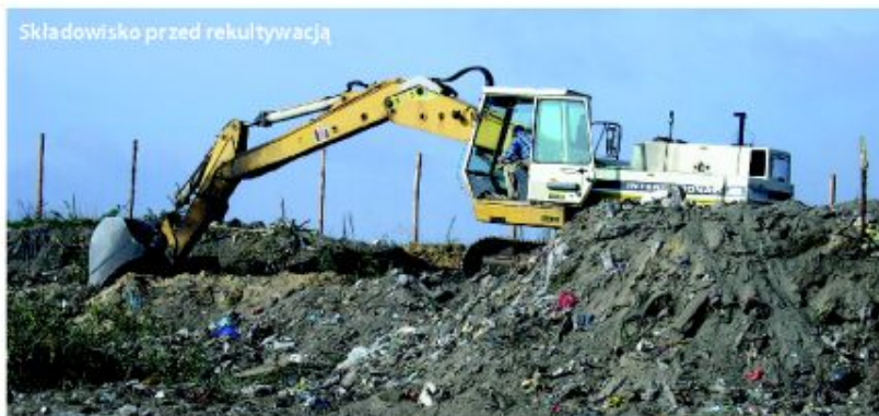
Składowisko przed rekultywacją

Pierwszą gminą w powiecie tureckim, która dokonała rekultywacji składowiska odpadów jest gmina Brudzew. Ukształtowanie nowych wartości gruntu dotyczyło terenu wysypiska śmieci w miejscowości Smolina.