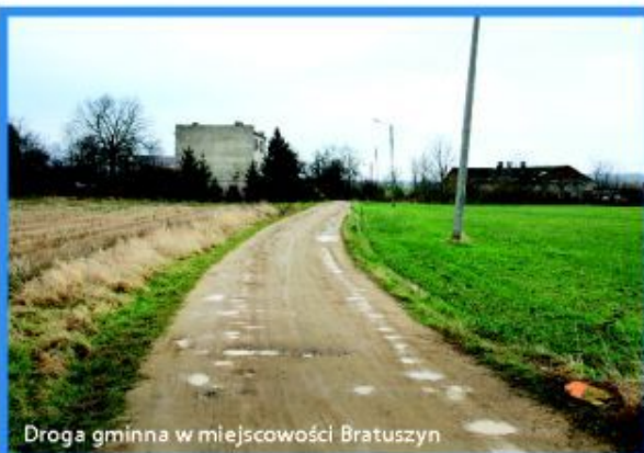
Droga gminna w miejscowości Bratuszyn