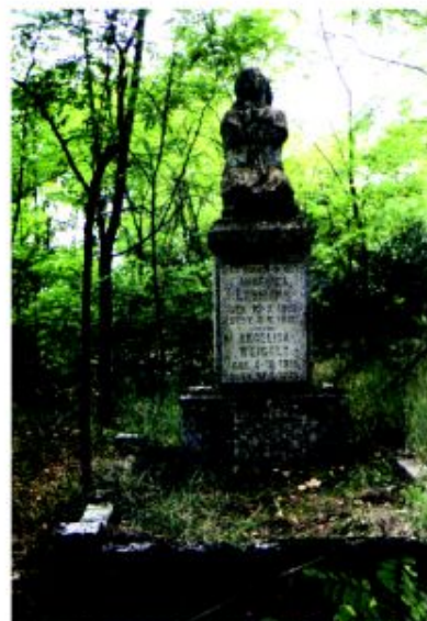
Nagrobek na cmentarzu ewangelickim w Tątnowie