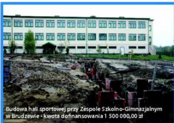
Budowa hali sportowej przy Zespole Szkolno-Gimnazjalnym w Brudzewie - kwota dofinansowania 1 500 000,00 zł