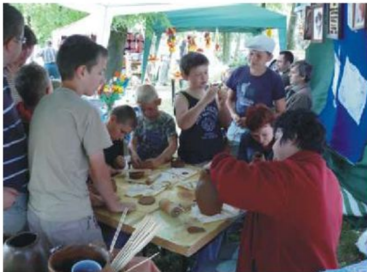
Garncarstwo to trudna sztuka

Rzeźba w drewnie, haft gobelinowy, Gościli u nas przedstawiciele rękodziela: garncarstwo, koronkarstwo, artystycznego z Muzeum Rzemiosła