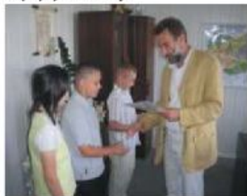
Wójt gratuluje laureatom