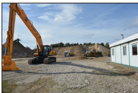
KRUSZGEO WIELKOPOLSKIE KOPALNIE